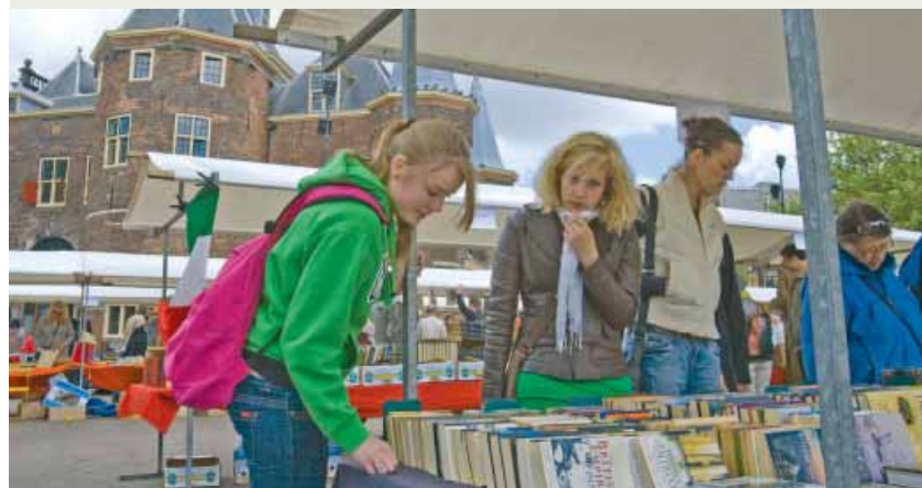
In Amsterdam vond gisteren de grootste boekenmarkt ter wereld plaats met vijf kilometer aan boekenkramen.

Wereldboekenstad Lekker in de boeken neuzen